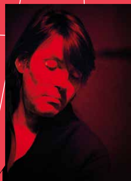
4 Fabrizio De André. Sguardi randagi