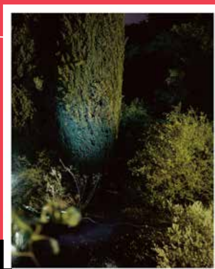
4 ALIZIA LOTTERO Gardens Memos