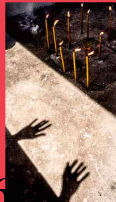
6 LORENZO ZOPPOLATO La luce necessaria PREMIO PORTFOLIO ITALIA 2018 GRAN PREMIO LUMIX