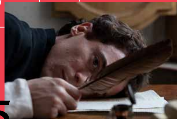
5 FONDO CLICIAK CENTRO CINEMA CITTÀ DI CESENA Sguardi in macchina. Sul set, tra gioco e seduzione

6 CONSORZIO DI BONIFICA VIA GARIBOLDI, 45