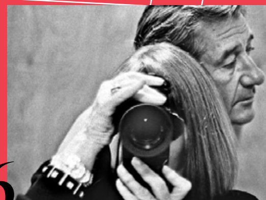
6 PROIEZIONE HELMUT BY JUNE REGIA DI JUNE NEWTON