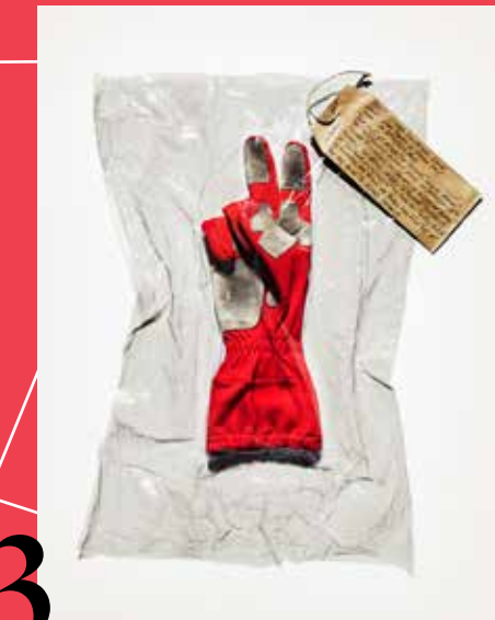
3 MARCO CRAIG Witness

4 MONTE DI PIETÀ CORSO VENDEMINI, 53 3 MONTE DI PIETÀ VIA DEL MONTE DI PIETÀ, 1